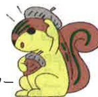
守山区キャラクター モリスちゃん