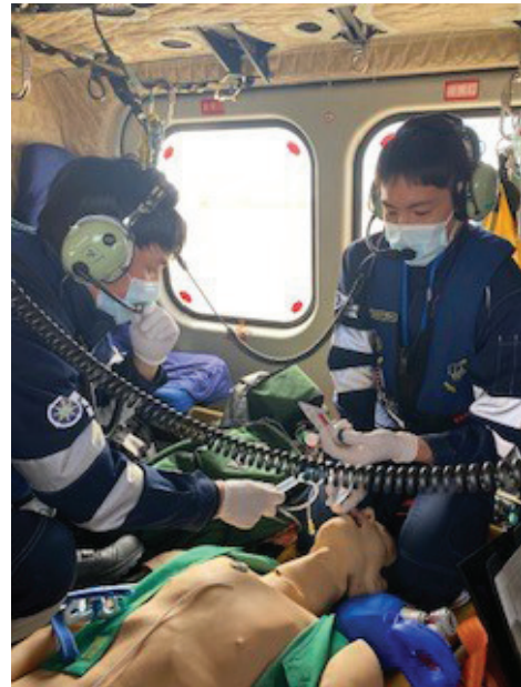
図3 慣熟訓練での機内の様子

このように特殊な環境下で最善の診療を行うために、「洋上救急慣熟訓練」が行われる。全国各地域で定期的実施される慣熟訓練では、医師・看護師が実際にヘリコプター等に搭乗し、飛行中の揺れや騒音を体験し実動に備えている。具体的には、患者を想定したマネキンに対する機内での処置、通信機を用いたコミュニケーション、患者吊上げ救助の見学、機内設備や搭載される資機材の確認などを実施している。洋上での救急業務を理解し、通常診療とは全く違う現場環境での診療を経験するとともに、海上保安庁の乗務員との連携を構築する貴重な機会にもなっている。