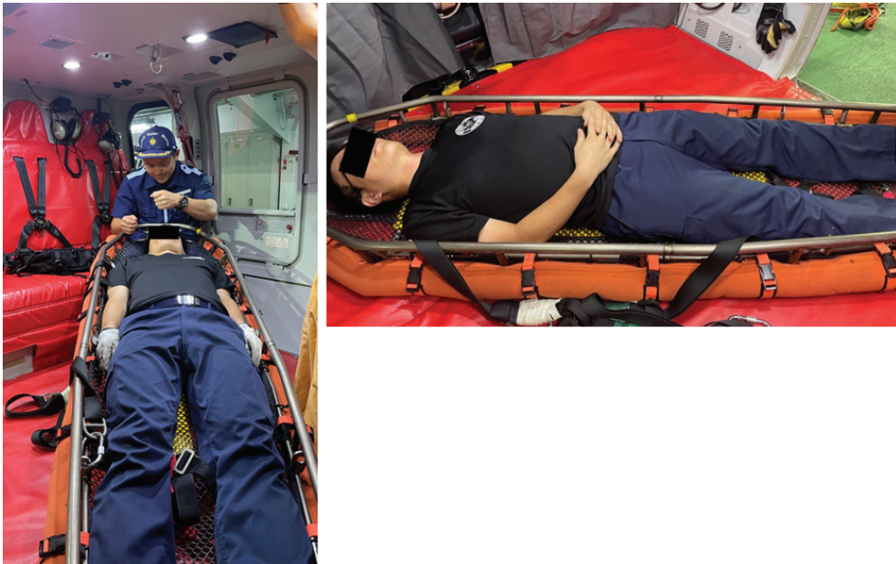
図2 航空機内に収容した傷病者(訓練時の写真)

後は地上の救急隊に引き継ぎ、患者は直近の救命センターに搬送された。診断は急性硬膜下血腫、脳挫傷、腰椎破裂骨折、腰髄損傷。医師の派遣から帰院まで約 11 時間であった。